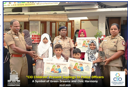
“CIO Children, Present Saplings to Police Officers A Symbol of Green Dreams and Civic Harmony 20.07.2025

தொடர்ந்து ஜூலை 27 அன்று CIO கோவை சார்பாக நடைபெறவுள்ள “மண்ணில் கைகள், இந்தியாவோடு இதயங்கள்” பிரச்சார இயக்கத்தின் இறுதி நிகழ்வான குழந்தைகளின் சுற்றுச்சூழல் பேரணிக்காக காவல்துறையிடம் தங்கள் மழலை மொழியில் அனுமதியை கேட்டனர்.